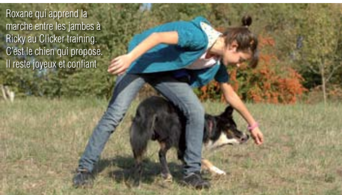
Roxane qui apprend la marche entre les jambes à Ricky au Clicker training. C'est le chien qui propose. Il reste joyeux et confiant

Cette méthode consiste à cliquer tout comportement ou position que le chien offre de façon spontanée sans que le maître ou l'éducateur n'ait exercé d'influence. Exemple : mon chien se couche de lui-même, je clique, je récompense.